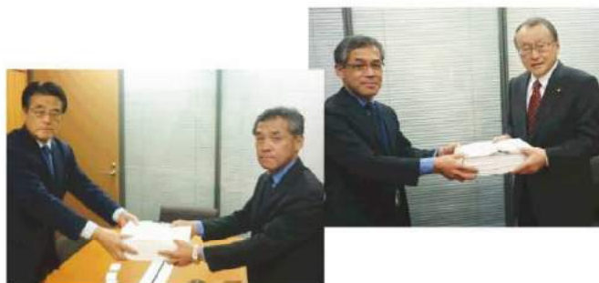
岡田克也衆議院議員・中川正春衆議院議員に 署名を手渡す

※ 署名用紙を地区や事務局に届ける方法がない場合は8ページの封筒をご活用ください。