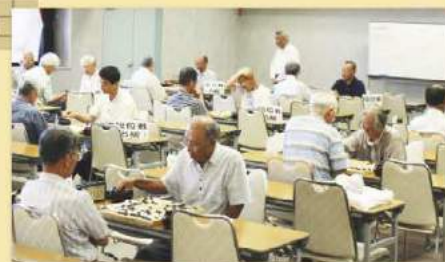
<昨年度の対局の様子>

と き 9月7日(土) 受付9時～開会9時30分 と ころ 三重県教育文化会館 5階 大会議室 津市桜橋2-142 TEL 059-228-2077