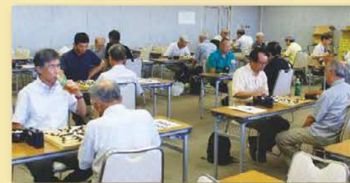
<昨年の対局の様子>