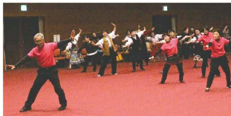
《紀和レクダンスフェスにて》