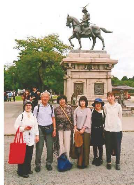
《全国大会 in 仙台に参加して》

高齢化社会にあって、ダンスは認知症予防に最適といわれる。踊る事で汗し、表現や仲間と触れ合う楽しさ、ひいては自身の健康、生き甲斐、仲間、絆づくり等につながると確信している。最後に安心して踊れるよう新型コロナウイルス感染問題が早く収束することを願うばかりである。