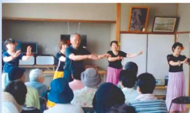
《高齢者サロンの一コマ》

私が教職につき間もなく、先輩方で組織された紀南レククラブに入会し、キャンプやレク祭、ウォークラリー、ユニカール等主催し、その運営に関わり楽しんでいった。30代半ば頃先輩によるダンス講習会やレク資格取得のため津、四日市、鈴鹿での宿泊講習会等でダンスの楽しさに触れてきた。印象に残っているのは“ハーモニカ”“おおシャンゼリゼ”。以来、三重県レクダンス研究会に入会し、県民レクダンスフェス3～30回や全国、三重県支部ダンス講習会等に参加。現在は紀南の地で4サークルを持ち、紀南レクダンスフェスやクリスマスダンスを開催しながら会員の皆さんと踊りを楽しんでいる。他に高齢者サロンで年数回のゲームやダンスも楽しみの一つ。