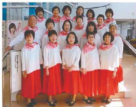
《鶴殿レクダンスの仲間》

私達の鶴殿レクダンスサークルでは発表に向け、1月から練習に励み衣装等考えながら取り組んでいただけに残念！会員は「しかたないね」と納得。しかし、発表がなくサークル活動も中止となると「寂しいね」「早く収まってほしいね」と多くの声。